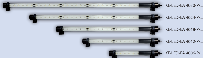
KE-LED-EA 4030-P/... KE-LED-EA 4024-P/... KE-LED-EA 4018-P/... KE-LED-EA 4012-P/... KE-LED-EA 4006-P/...