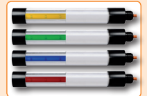
Farbvarianten auf Anfrage color variants on request